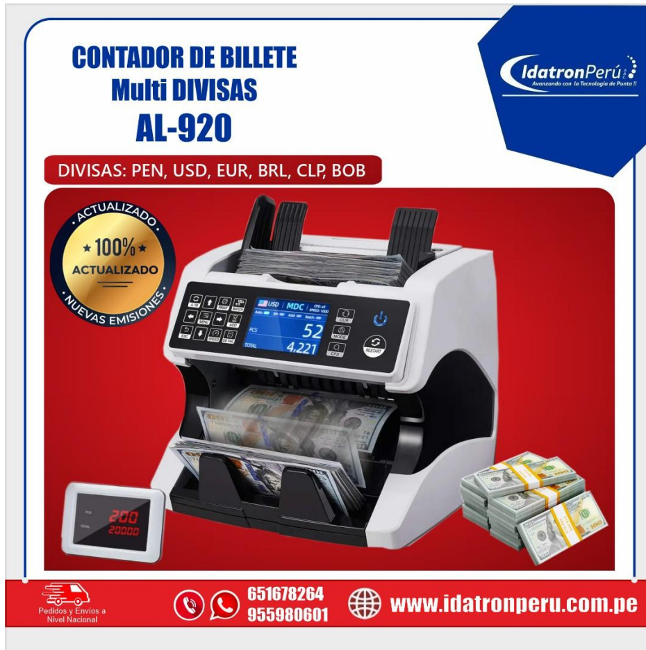
IMAGEN REFERENCIAL DEL PRODUCTO