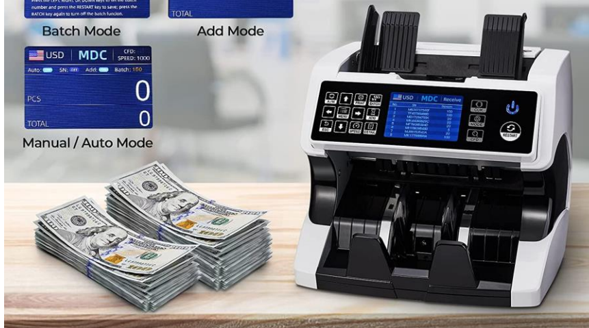
Manual / Auto Mode